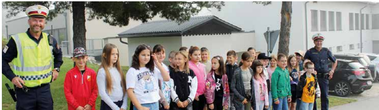
Zur Sicherheit unserer Kinder Schulstraße in Ruden